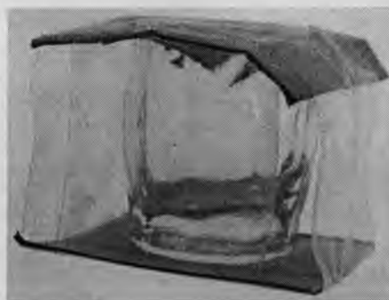
Рис. 6-7. Некоторые варианты упаковки рюмок, стопок