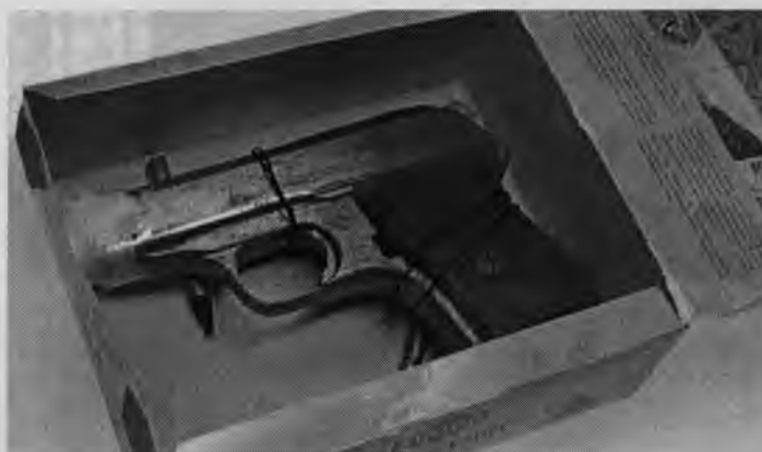
Рис. 8. Упаковка короткоствольного огнестрельного оружия

Типичное заблуждение следователей, что при включении специалиста в состав следственно-оперативной группы, им нет необходимости разбираться в отдельных тактических приемах по работе со следами рук, которые применяет специалист. Следователю необходимо помнить, что при отсутствии таких познаний он не сможет в полном объеме осуществлять руководство осмотром и полноценно взаимодействовать со специалистом. Именно следователь координирует действия участников группы, осуществляет руководство осмотром и несет ответственность за его производство!